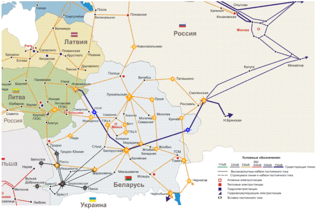
Карта межрегиональных перетоков электроэнергии